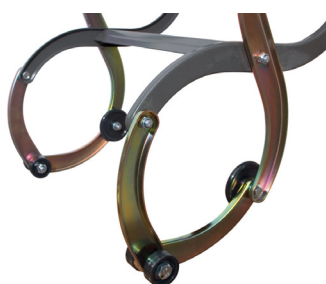
Marches de l'échelle