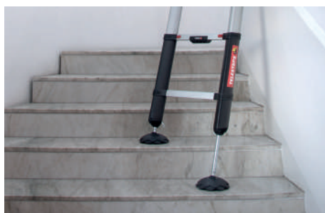
LES PIEDS DE SECURITE