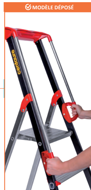
2 RAMPES D'ACCÈS EN ALUMINIUM équipées de poignées ergonomiques