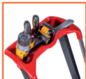
TABLETTE PORTE-OUTILS ERGONOMIQUE pour un appui confortable des jambes et de grande contenance.