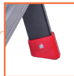
LARGES PATINS VISSÉS ANTIDÉRAPANTS POUR PLUS DE STABILITÉ.

TESTÉ À 260 KG Essai réalisé en condition d'utilisation, les 4 pieds en appui sur un sol en béton. Application d'une charge de 260 kg au niveau de la plate-forme.