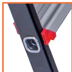
MARCHES ALUMINIUM solidement fixées aux montants par sertissage.