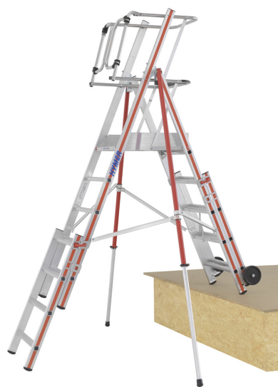
Utilisation possible dans des escaliers