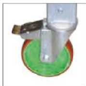
Roues arrières avec frein Ø 125 mm