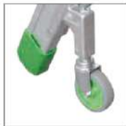
Roues avant pivotantes et autobloquantes avec ressort Ø 80 mm