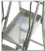
Plate-forme de travail 48x77 cm