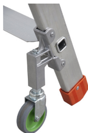
Schwenkrollen mit Blockierung