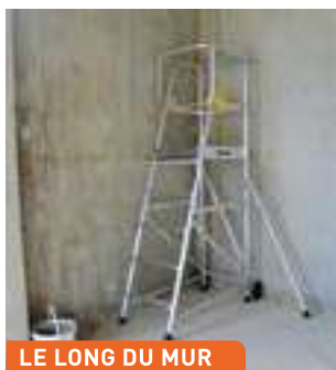
LE LONG DU MUR