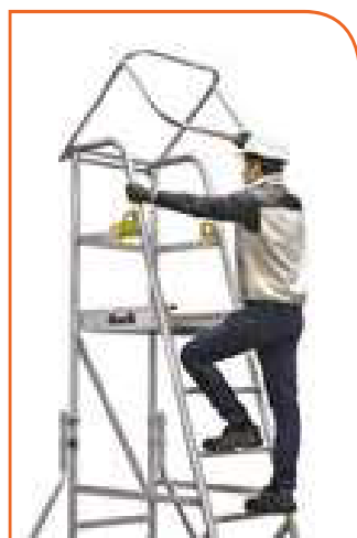
Garde-corps avec butée anti-basculement.