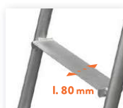
Marches antidérapantes de 80 mm