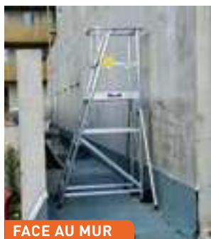
FACE AU MUR