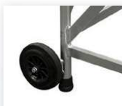
Roues Ø 200 mm. Non porteuses en position de travail.