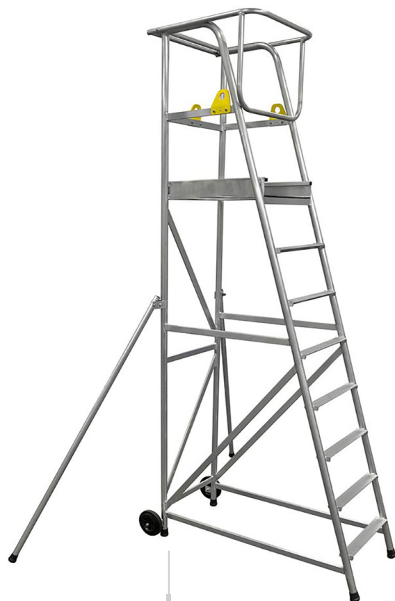
PLATEFORME 8 marches