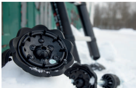
RONDELLE A PERNO