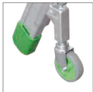
Ruote anteriori girevoli e autobloccanti con molla Ø 80 mm