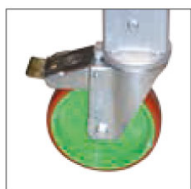
Ruote posteriori con freno Ø 125 mm