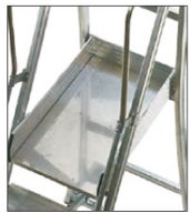
Piattaforma di lavoro 48x77 cm